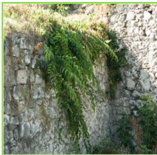
Слика 2. Кисело дрво у комплексу Тврђава Ниш

Због свих особина насељава крајње неповољне терене, са слабо развијеним земљиштем, на местима где друге биљне врсте не могу опстати. Данас је ова врста широко заступљена у урбаним срединама. Изузетно је агресивна инвазивна врста и зато је неопходно предузети мере како би се овај проблем превазишао.