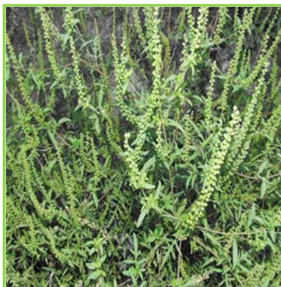
Слика 4. Амброзија ( Ambrosia artemisiifolia L.)

По животној форми спада у терофите, што значи да неповољни период преживљава у облику семена.