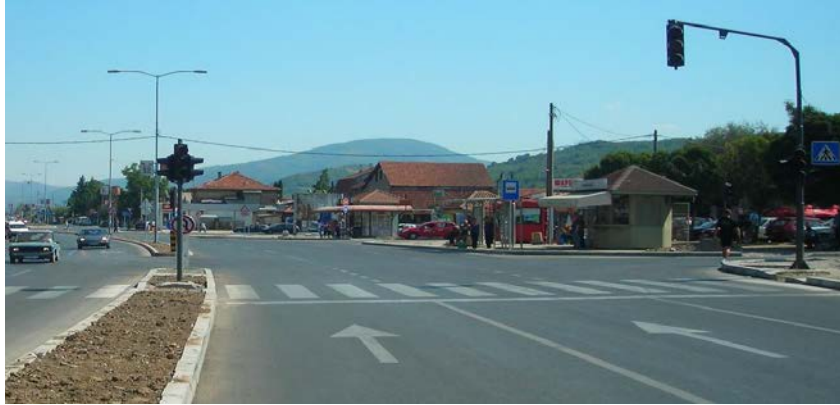
Раскрсница на Трошарини, током радова на семафоризацији

Осим одржавања изводимо и радове на семафоризацији нових раскрсница, тако да у 2017. години очекујемо добијање посла на семафоризацији раскрсница Булевар светог цара Константина – II Нишавска, Сомборска – Деспота Ђурђа, Булевар Николе Тесле - Александра Медведева и Булевар Николе Тесле – Данила Киша.