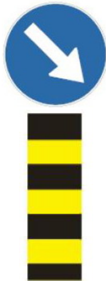
Саобраћајни знакови новије генерације, са рефлектујућом фолијом III класе

ЈКП „Паркинг сервис“, којем је поверен посао одржавања вертикалне сигнализације, врло професионално приступа задатим пословима. Почев од набавке нове опреме технолошки савремене вертикалне сигнализације, уз сагласност са управљачима путева тако и сталним тежњама ка набавци нове опреме и стручном оспособљавању људства. За те намене у наредној години на располагању нам је пет отворених возила – путара, од којих су четири млађа од пет година, три агрегата, три пикамера, опремљена браварска радионица и магацински простор.