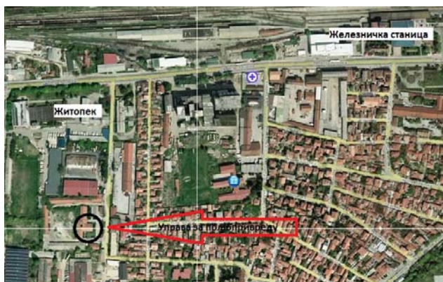
Зграда Управе у Лесковачкој улици

Телефон Управе је 018/290-242 а факс 018/290-243.