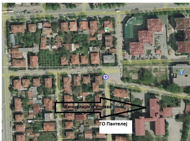
Канцеларија Управе у ГО Пантелеј