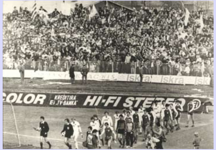
Детаљ са утакмице КУП-а УЕФА 1982. Раднички-Хамбургер

Реконструкција стадиона "Чаир" започета је припремним радовима на источној трибини која није у функцији последњих 15 година. Главним пројектом предвиђена је реконструкција трибине на источној страни за 6966 гледалаца. После источне следи реконструкција јужне и северне трибине које ће моћи да приме 9037 гледалаца, док ће западна трибина после радова бити отворена за 2154 навијача.