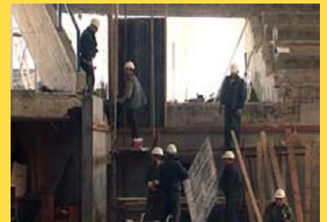
У току је реконструкције спортске хале "Чаир"

Нишки стадион изграђен је 1963. године и у тај објекат није улагано последњих 30 година. После реконструкције нишки стадион добиће сасвим нови изглед и биће реконструисан по стандардима ФИФА.