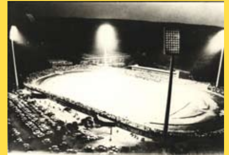
Прва утакмица под рефлекторима на стадиону Чаир

Нишки стадион изграђен је 1963. године и у тај објекат није улагано последњих 30 година. После реконструкције нишки стадион добиће сасвим нови изглед и биће реконструисан по стандардима ФИФА.