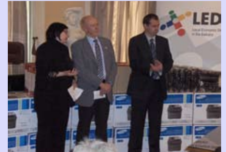
Додела компјутерске опреме и софтера средњим стручним школама

Град Ниш је кроз ЛЕДИБ програм реализовао пројекат "Промоција предузетничких вештина у средњим стручним школама".