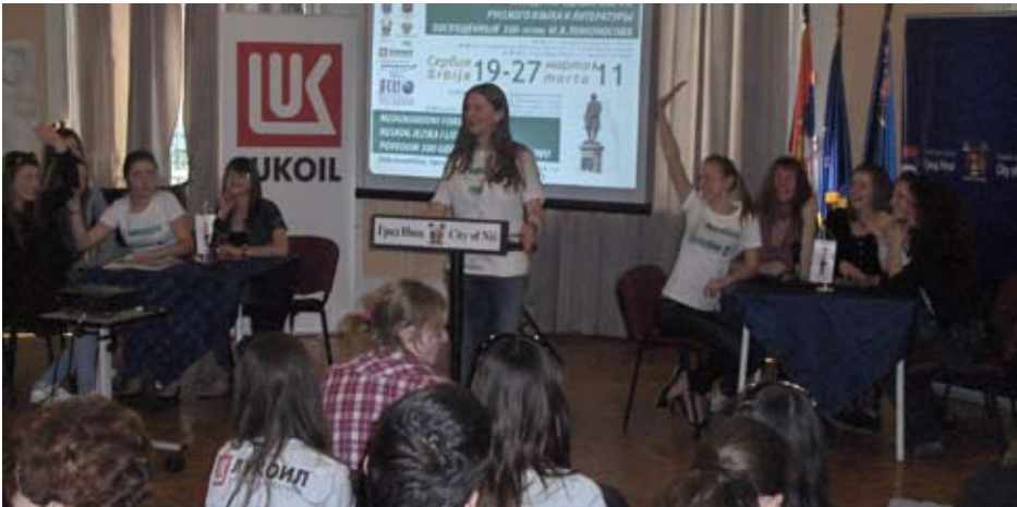
Међународни форум руског језика и књижевности

У Градској кући одржан је Међународни форум руског језика и књижевности, поводом 300 година од рођења познатог руског писца и научника Михаила Васиљевича Ломоносова, у организацији Агенције за међународне пројекте у области културе, образовања и спорта" (IPCES) из Москве, у сарадњи са Одбором фестивала „Живот градова“.