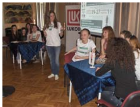
Такмичењу у знању, на тему живота и рада Ломоносова