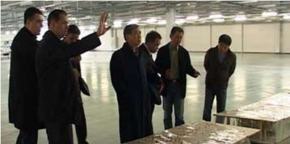
Обилазак новоизграђене хале компаније "Јура" у индустријској зони Доње Међурово