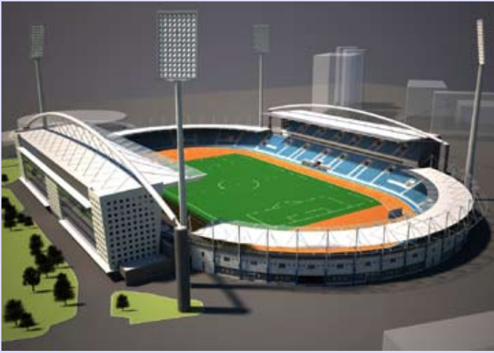
Будући изглед градског стадиона Чаир