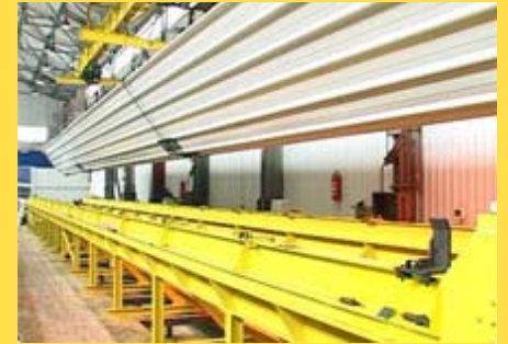
Производни погон француске компаније "Batiqoc" у Нишу

Француска компанија "Batiqoc" отворила је у Нишу, уз подршку пословних партнера "Batiroc" и "AXE METAL", своју нову фабрику.