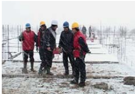
Обилазак радова на изградњи школе у насељу Бранко Бјеговић

Министарство просвете Републике Србије дало је своју сагласност на одвајање истуреног одељења у Брзом Броду Основне