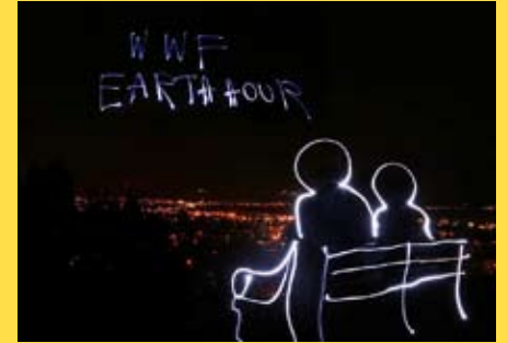
Сат за нашу планету

Град Ниш, невладине организације Простор, Зелени кључ, Зоопланет и Зелена мрежа града Ниша трећу годину за редом организовали су акцију „Сат за нашу планету“.