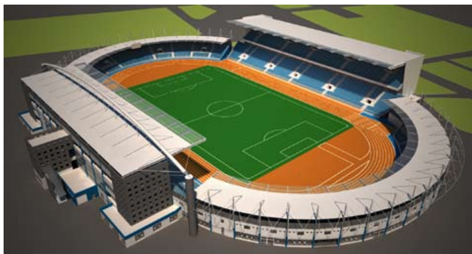
Будући изглед градског стадиона Чаир