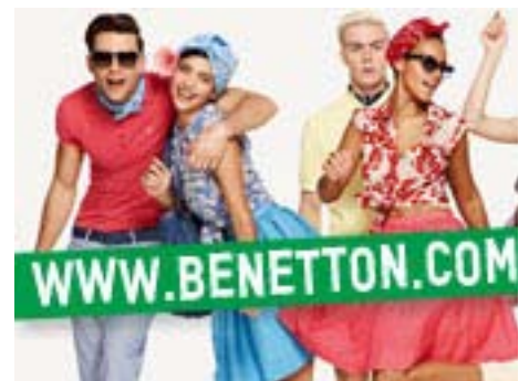
"Бенетон Србија" из Ниша

"Бенетон" намерава да један део објеката "Нитекса" реконструише, док ће хале које не задовољавају његове стандарде и потребе производње срушити и изградити нове. У њима ће бити инсталирана потпуно нова опрема. Град Ниш ће пружити максималну административну подршку у реализацији инвестиције