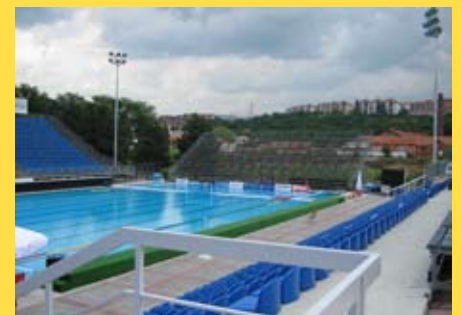
Комплекс базена у оквиру спортског центра "Чаир"

После изградње отворених базена и реконструкције хале "Чаир" као и потпуном реконструкцијом стадиона у "Чаиру", Ниш ће добити јединствени спортски комплекс. Изградњом свих ових објеката Ниш ће обновити и завршити изградњу комплетне спортске инфраструктуре.