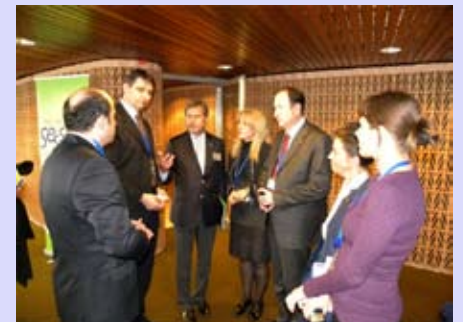
Конгрес у Стразбуру

Конгрес локалних и регионалних власти Савета Европе, као консултативно тело Савета Европе, одржао је своје 20. Пленарно заседање у Стразбуру, Француска.