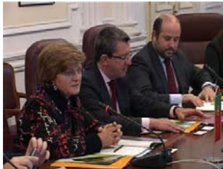
Делегација из Португалије

напорима које Град Ниш улаже у очување животне средине, као и активностима на пољу урбаног панирања у функцији локалног економског развоја и резултатима који су до сада постигнути у овим областима.