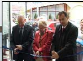
2 ЦЕНТАР ЗА ЗАПОШЉАВАЊЕ