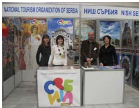
Штанд Туристичке организације на сајму Културни туризам 2010 у Великом Трнову у Бугарској

На сајму су се представили сви већи градови Бугарске и других држава са којима су представници Града Ниша успоставили контакте и разменили искуства. На заједничком штанду са Туристичком организацијом Србије, Туристичка организација Ниша успешно је промовисала културно-историјске потенцијале града Ниша и предстојеће културне догађаје као што је обележавање Миланског едикта 2013. године у Нишу.