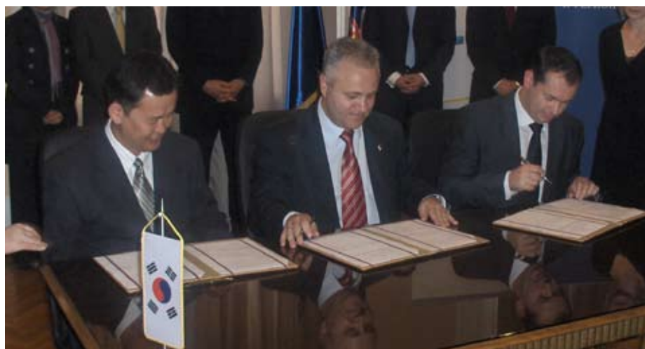
Потписивање Меморандума о разумевању између Министарства економије и регионалног развоја, Града Ниша и „Yura Corporation“