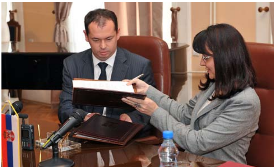
Потписивање Меморандума о сарадњи - градоначелник Ниша Милош Симоновић и Министарка правде Републике Србије Снежана Маловић

Министарка правде Републике Србије Снежана Маловић и градоначелник Ниша Милош Симоновић потписали су Меморандум о сарадњи у извршењу алтернативних санкција.