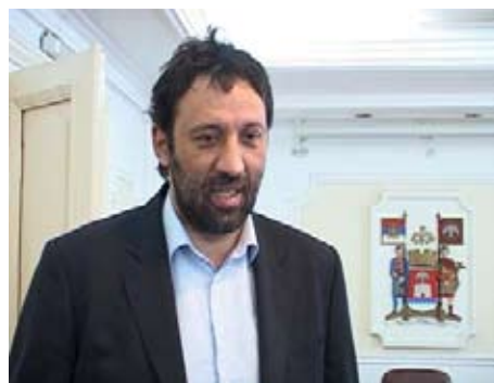
Владе Дивац председник Олимпијског комитета

Караван ЕкоОлимпијаде, манифестације коју Олимпијски комитет Србије спроводи у сарадњи са Министарством животне средине и просторног планирања, кренуо је из Суботице, а осим Ниша за сада је познато да ће домаћини ове акције бити и Косјерић, Нови Сад, Петровац на Млави, Београд. У Суботици је