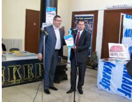
Први Сајам некретнина

На Сајму некретнина, у Дому војске, на преко 20 штандова излагачи и инвеститори представилиће посетиоцима услове за куповину и изнајмљивање станова. Сајам је намењен инвеститорима, пројектним бироима, извођачима радова, агенцијама за промет некретнина, кредитним и осигуравајућим кућама и закупцима некретнина. На Сајму некретнина и инвестиција биће представљене и нове стамбене локације у улицама Мајаковског, Петра Ранђеловића и Инжењера Бирвиша на којима ће бити изграђени станови по знатно нижим ценама који су намењени социјално угроженим групама. Посебно је важно и представљање урбанистичког плана Ниша и планске документације која ће инвеститорима