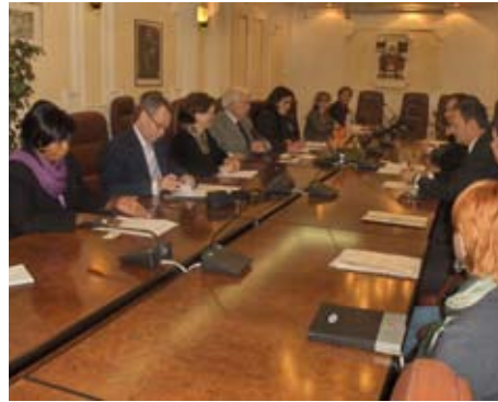
Пријем за делегацију удружења „Удружени градови Француске“ у Градској кући

Ниша и републике Француске веома блиска и интензивна у свим областима, од културе и образовања до привредних активности.