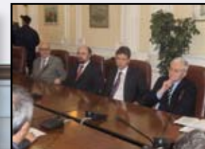
5 ДЕЛЕГАЦИЈА КРИЗНОГ МЕНАЏМЕНТА БЕЧА У ПОСЕТИ НИШУ