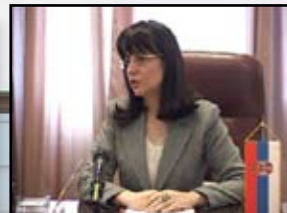
4 САРАДЊА НИША И МИНИСТАРСТВА ПРАВДЕ