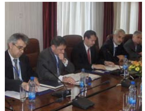
Округли сто „Правци и модалитети међународне сарадње града Ниша у области науке и образовања“

Резултати рада Округлог стола ће бити уграђени у Програмске документе пројекта чије се усвајање очекује током маја месеца.