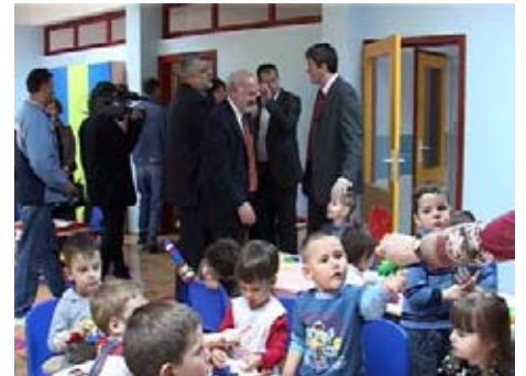
Новоотворено обданиште у Дуваништу

Током обиласка радова на изградњи нове школе у насељу "Бранко Бјеговић" речено је да Град Ниш улаже максималне напоре како би ово насеље било потпуно комунално и инфраструктурно опремљено. Поред тога мештанима