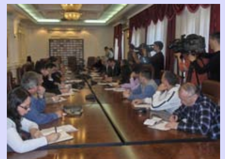
Градска кућа Ниш