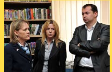
Донација амбасаде САД Народној библиотеци “Стеван Сремац”

Народној библиотеци “Стеван Сремац” Амбасада САД донирала је информатичку опрему у вредности од 4500 долара.