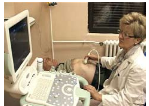
Заводу за здравствену заштиту радника

овој здравственој установи отворен је Call - центар Хитне помоћи, а у насељима Нишка Бања и Ледена Стена отворене су испоставе Завода за хитну медицинску помоћ.