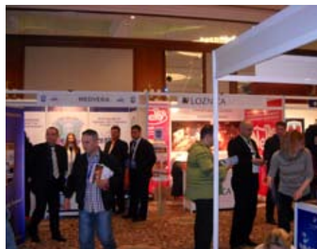
Инвестируйте в Сербию

USAID Программа муниципального экономического роста работает с некоторым городам и муниципалитетам в Сербии и оказывает им поддержку в создании благоприятной среды для развития бизнеса. Соревнование "Инвестируйте в Сербию" местным органам власти обеспечивает углубление взаимных контактов и является форумом для установления дальнейшего сотрудничества и содействия экономическому развитию в Сербии.