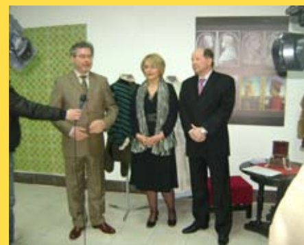
Первая годовщина почетного консульства Республики Венгрии

Выставку открыл посол Венгрии в Сербии господин Имре Варга, в присутствии заместителя мэра Города Ниша госпожи Надьи Маркович и почетного консула Республики Венгрии в Нише господина Милоя Бранковича.