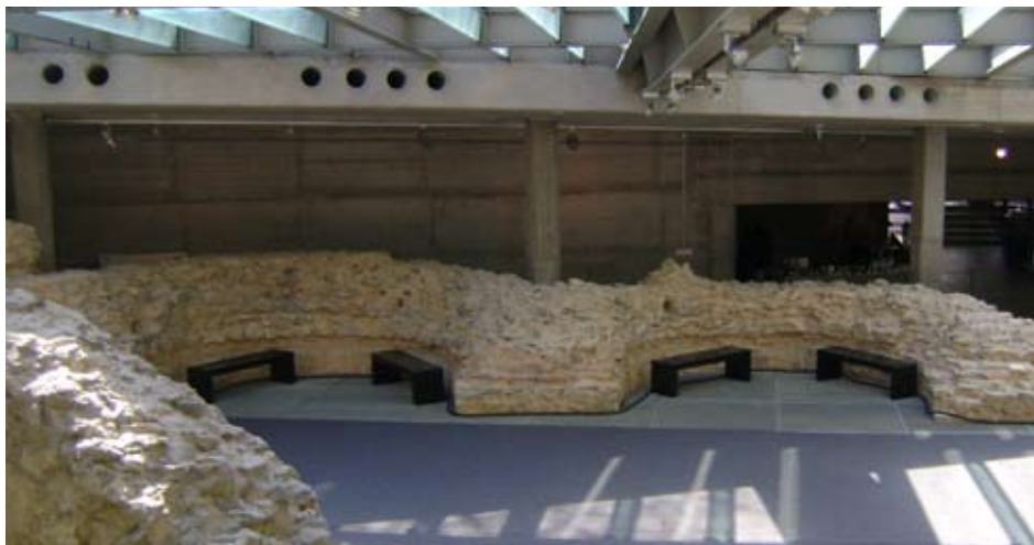
Делегация Ниша посетила культурную столицу Европы