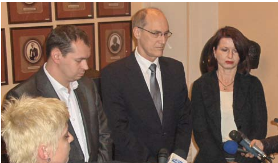
Канадский посол первый раз в Нише

Мэр Ниша, Милош Симонович встретился с послом Канады в Сербии Джоном Морисоном. Это первый официальный визит посла Канады Городу Нишу.