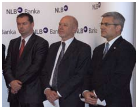
Кредитная линия ЛЕДИБ программы для малых и средних предприятий и предпринимателей