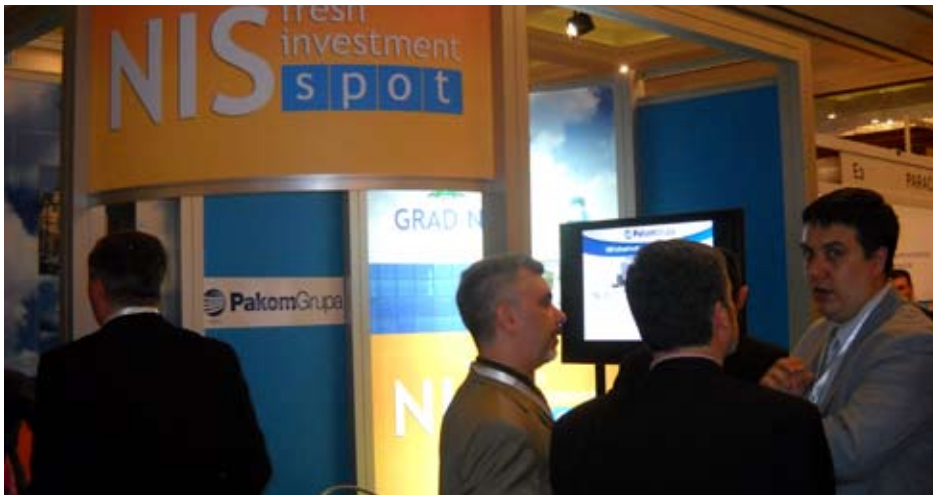
Инвестируйте в Сербию

Город Ниш получил приз за лучшее исполнение на ярмарке, на соревновании местных органов власти в поощрении инвестиций "Инвестируйте в Сербию".