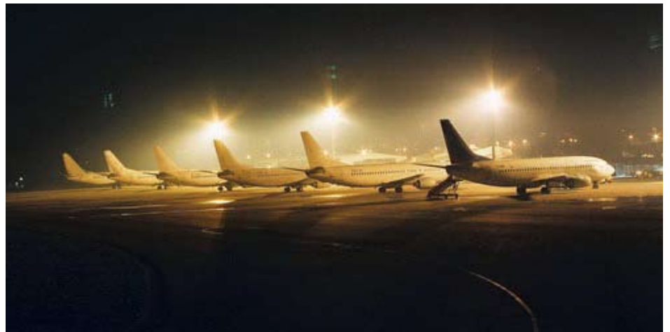
Аэропорт „Константин Великий“