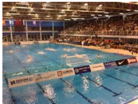
Новый сезон начался на реконструированном бассейне