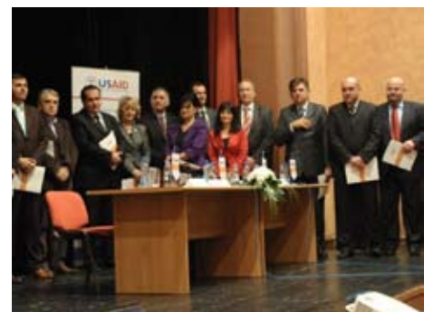
Соглашение о вступлении в процесс сертификации для муниципалитетов с благоприятной деловой средой

Кроме Города Ниша, 17 других муниципалитетов подписали соглашение о вступлении в процесс сертификации.