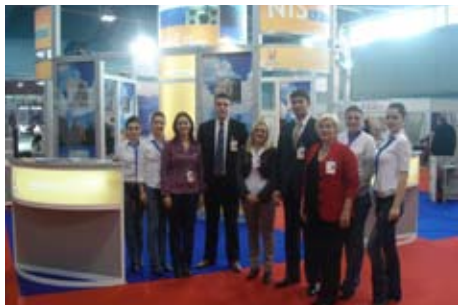
Представители Города Ниша на 4-ой Международной ярмарке инвестиций и недвижимого имущества Investexpo 2009

Город Ниш вместе с агентством недвижимости Colliers International представили городские местоположения для инвестиций, уже подготовленные к аренде: Лозни Калем, Скоплянска и Донье Меджурово, а помещение Холдинг корпорации "Электронная промышленность Ниш" было представлено как удобное для brown-field инвестиций.