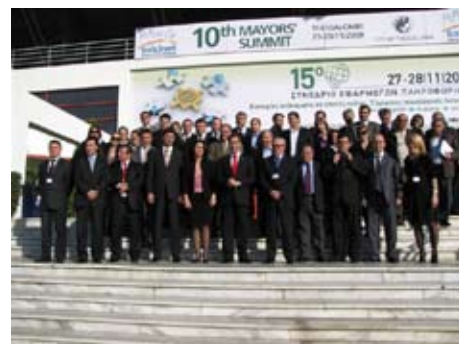
Мэры ведущих балканских городов

Основная цель сети БАЛЦИНЕТ заключается в укреплении сотрудничества между балканскими городами и развитии экономических и культурных связей местных органов власти в этой части Европы. Такое сотрудничество позволяет мирного сосуществования стран и народов на Балканском полуострове, и