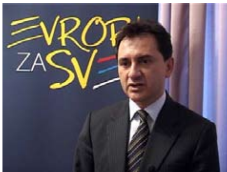
Вице-президент Правительства Сербии Божидар Джелич на презентации проекта „Европа для всех“

Он отметил, что введение новых рейсов из Аэропорта „Константин Великий“ удалит еще одно препятствие для граждан этой части Сербии.