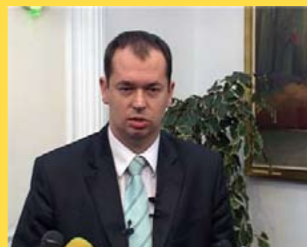
Мэр Милош Симонович

подписании специального соглашения с JAT-ом, потому что Город намерен не позволить повторить то, что случилось в прошлом, когда из-за малого количества пассажиров или из-за политики национальной авиакомпании, били поставлены под сомнение регулярный рейсы из Ниша.