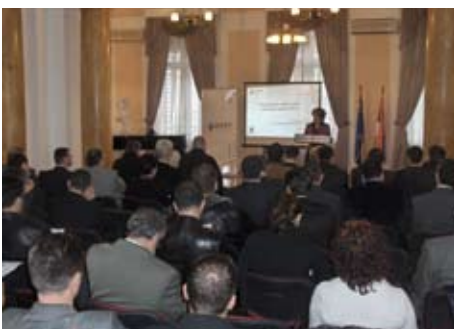
Презентация Департамента по вопросам местного экономического развития

Презентация была посвящена достигнутым результатам и дальнейшим планам работы. Представители MEGA и LEDIB программы также говорили о сотрудничестве с Департаменте по вопросам местного экономического развития.