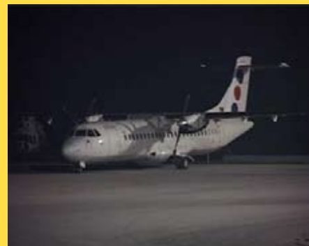
JAT снова будет летать с Аэропорта „Константин Великий“

JAT 8 октября прекратил единственный оставшийся рейс из Ниша из-за, как тогда заявили, небольшого числа пассажиров.