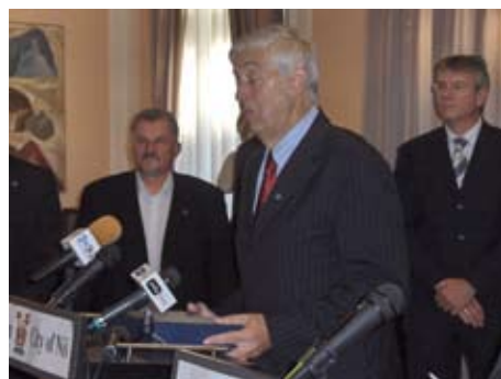
Джордже Перишич, президент Международной комиссии Федерации водного поло Сербии