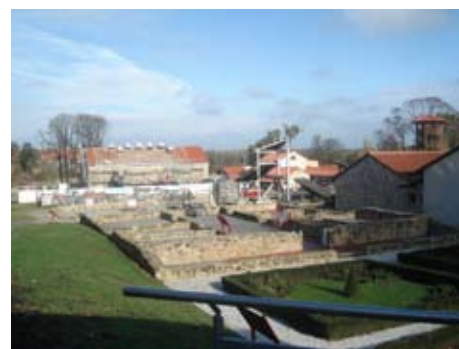
Археологический парк Карнунтум

сотрудничества исторических городов и исторических помещений императоров Карнунтума, среди которых и Ниш нашел свое место, а также и в организации общих художественных мероприятий для предстоящего 1700-летия подписания Миланского эдикта, в рамках международного художественного проекта „Императоры Карнунтум которые