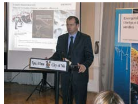
Мэр Города Ниша Милош Симонович

Мэр Симонович поделился информацией о том, что Город Ниш вместе со Министерством иностранных дел Королевства Швеции сотрудничает в Исследовании по вопросам энергосбережения, которое будет указать на реальные потребности Города Ниша.