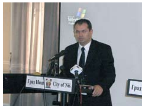
Мэр Города Ниша Милош Симонович

Министр Дулич поздравил мэра Симоновича с достигнутыми результатами, и добавил, что не так много муниципалитетов в Сербии признали важность решения проблем охраны окружающей среды.