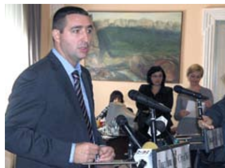
Министр Оливер Дулич

на различные проекты в области охраны окружающей среды. Также, Город обеспечил значительные средства из национального бюджета и от иностранных доноров, для реализации экологических проектов и для проектов в области устойчивого развития.