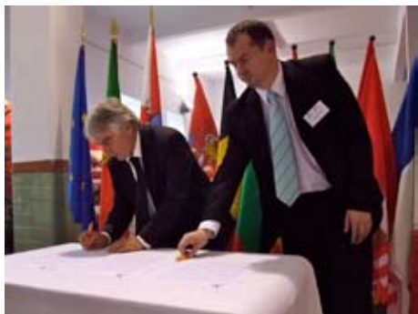
Мэр Города Ниша Милош Симонович

Сеть была создана в 1997 году со штаб-квартирой во французском городе Арле. Центральный офис этой Ассоциации находится во французском городе Тур. В организации AVEC сейчас вместе города и территории европейских стран, которые имеют богатую историю и культурное наследие, и которые посвящены