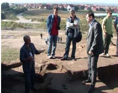
Мэр Города Ниша Милош Симонович

Эти места выявили остатки поселения датируемые с IV и V века до нашей эры.