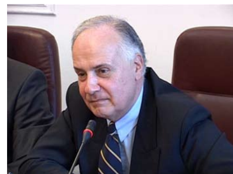
Посол России Александр Конузин

Исполнительный директор Компании "Югоросгаз" Владимир Колдин сказал, что газовые