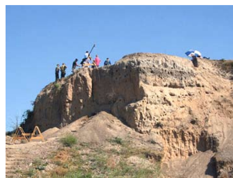
Археологические участки Хумска Чука

найденное там, могло быть сохранено от ухудшения и сделано доступным для всех посетителей.