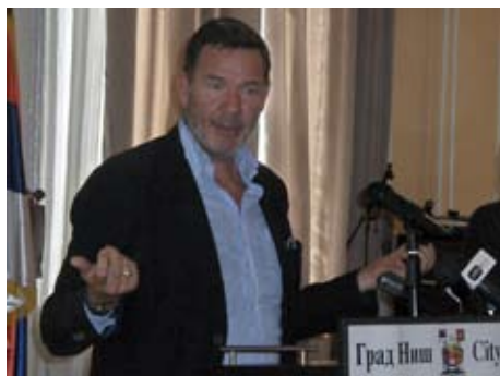
Посол Швеции Кристер Брингеус

конкретные меры. Прежде всего мы приступили к формированию Региона по управлению отходами Города Ниша и достигли консенсуса о необходимости совершенствования системы управления отходами в регионе, сказал мэр Симонович.