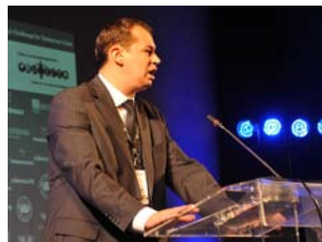
Мэр Города Ниша Милош Симонович

Это мероприятие собрало более 200 участников - представителей сербских и зарубежных деловых кругов, заинтересованных отечественных и иностранных инвесторов, представителей городов и муниципалитетов, представителей посольств и зарубежных торговых промышленных палат. Представители 12 посольств и торговых палат приняли участие в мероприятии: из Дании, Франции, Германии, Болгарии, Австрии, Испании, Словакии, Венгрии, Израиля, США и Южной Кореи.