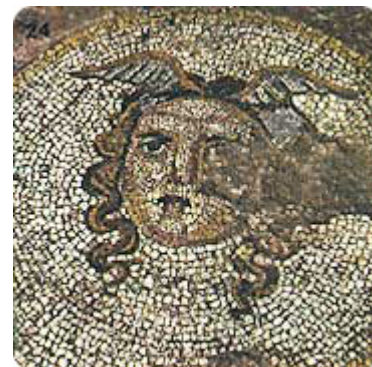
Медијана - мозаик

Ниша је Клаудије II победио Готе 269. године и спасио Рим велике опасности. Константин Велики, римски император (306-337), наследник Деоклецијана, је Naissus, у коме је рођен 274. године, украсио раскошним грађевинама (Медијана) и учинио га значајним економским, војним и административним центром.