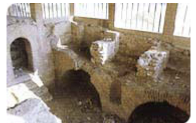
Ранохришћанска базилика 4.век

Град је добио име од реке Нишаве која кроз њега протиче и коју су келтски прастановници звали Navissos . Сваки освајач је давао своје име граду. Римски Naissus , византијски Nysos , словенски Ниш, немачки Nissa .