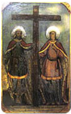
Стефан Немања и Свети Сава

О настанку Ниша постоји предање да га је саградио краљевић Ниша каменом с оближње хумске чуке. Има доказа да је Ниш насељен већ у праисторијско доба. Један војник из инжињеријске јединице ископао је 1878. године изнад тврђавског моста 153 мм дугу секиру-чекић направљену од базалта кога има у околини Островице у клисури Нишаве. Друга секира-чекић од 155 мм дуга, грубље израде, нађена је код старих гробова покрај Ниша, а једна кремена тестера код Врежине. Сви налази из перода од 4000 година пре н.е. могу се видети у Археолошком музеју у Нишу.