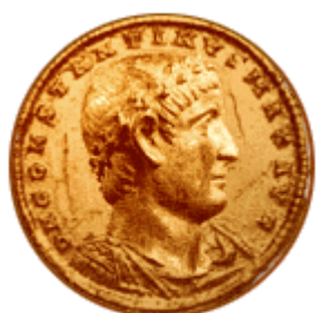
Новац Цара Константина

Мада се сматрало да је Ниш неосвојив град у својој дугој историји је више пута освајан, рушен и спаљиван. Хуни су Ниш заузели 441. године употребивши огромне јуришне справе и кишу стрела. Следеће разарање је било 448. године, а затим 480. године делимично обновљен град поново руше Варвари. Византијски цар Јустинијан обнавља Ниш, али у новим походима Авари га поново руше. На путу за Византију, 540. године, Ниш насељавају Словени. Око 987. године Ниш заузима бугарски цар Симеон. У 11. веку Византија поново колонизира Ниш и околину. 1072. године до Ниша су продрли Угри. Манојло I утврђује град, али његов наследник Андроник га губи. Осваја га угарски краљ Бела III. Кратко време после тога био је грчки, а 1185. године дошао је у српске руке, али за кратко. Исак Анђел побеђује Стефана Немању 1196. године. Ниш поново долази у српске руке 1241. године.