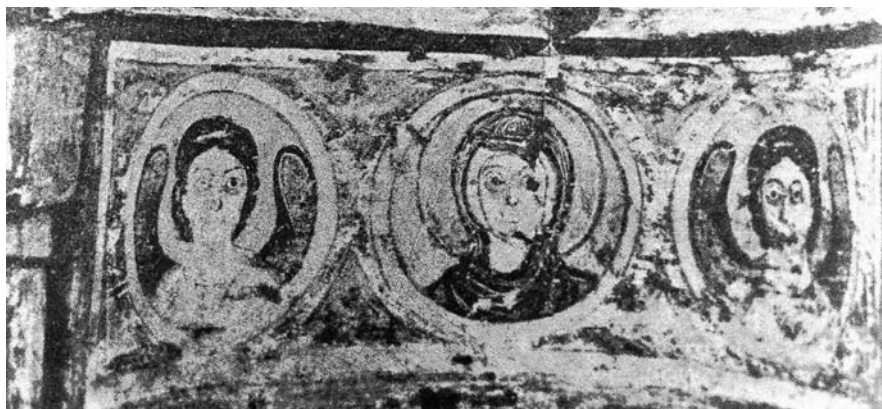
Fig. 3. Saqqara, chapelle B, fresque, La Vierge parmi les deux anges, détail de l'Ascension, (selon N. Gioles)

Сл. 3. Сакара, Капела Б, фреска, Богородица међу анђелима, детаљ Успења (по Н. Жиолу)