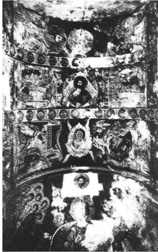
Fig. 4. Ubissi (Iméretie), Saint-Georges, vue générale de l'abside, (selon T. Velmans)

Dans les cas cités, le Mandyliion ne fonctionnerait pas seulement comme une valeur eucharistique évidente, preuve et signe de l'Incarnation par excellence 21 , mais il servirait, en principe, à mettre l'accent sur le symbolisme de la Seconde Venue du Seigneur, investissant la composition d'un appareil apocalyptique 22 .