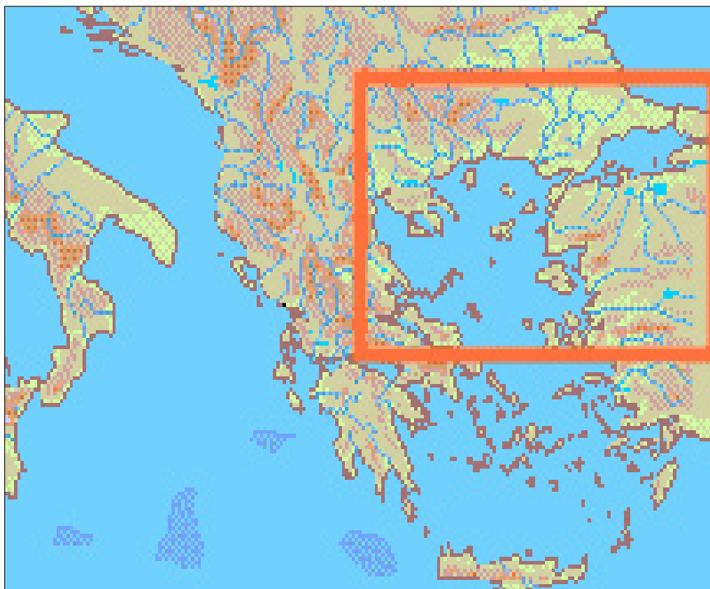
Sl. 5 Простор који је заузимало Латинско царство Fig. 5 The territory of the Western Roman Empire

(Норвешка). 13 Из истог столећа је илуминација „Силазак Светог Духа на апостоле” у француском Псалтиру који се и данас чува у Британској библиотеци у Лондону. 14 Тако се у делу „Чудо истинског крста” ( Historiae Sanctae Crucis , Bibliothèque Royale Albert ler, Bruxelles ) насталом 1483. године приказује темпларски крст исти онакав какав ће 1551. године приказати Пјеро де ла Франчеса ( Piero della Francesca ) у цркви Св.Фрање у Арцу на фресци „Откривање правих крстова”. У позадини је јасно истакнуто неколико симбола касније карактеристичних за Темпларе и касније слободне зидаре. У 19. столећу у катедрали у Буржу приказан је свети Луј Француски на обојеном стаклу – дакле, на стаклу чију су технологију донели управо Темплари у Европу – са пратећом темпларском иконографијом с леве, десне стране и у подножју. 15