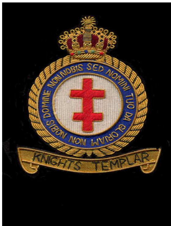
Sl. 6 Грб Реда Темплара

Овим чином ред се није угасио. На тлу Шпаније и Португалије изникла су два реда која истински наслеђују Темпларе – ред Христа и ред Монтесе. 19 Према бројним савременим истраживачима све је чешћа тврдња да су појединци из реда Темплара, предосетивши до чега ће доћи, основали наведена два реда која се ни по чему нису разликовала од основног Темпларског реда. Манир оснивања тајних редова, по узору на темпларски, карактеристичан је за цео средњи век што ће у новијој историји – тачније, од 18. столећа – резултовати оснивањем слободозидарских ложа које ће битно утицати на скоро сва значајнија догађања у савременој историји.