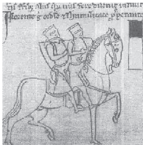
Sl. 4. Представа поноситих вitezова код Акре Fig. 4. A presentation of the proud knights at Akra

У Енглеској је 1485. године сер Томас Малори објавио причу „Артурова смрт” (Morte d' Artur), дело којим је завршен средњи век у енглеској књижевности 10 . Касније ће се у Шпанији јавити познати роман М. Сервантеса „Дон Кихот” као логички продужетак величања темпларске идеје.