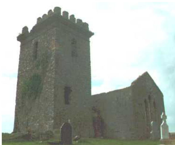
Sl. 3. Темпларска црква у Шкотској Fig. 3. The Knights' Templar church in Scotland