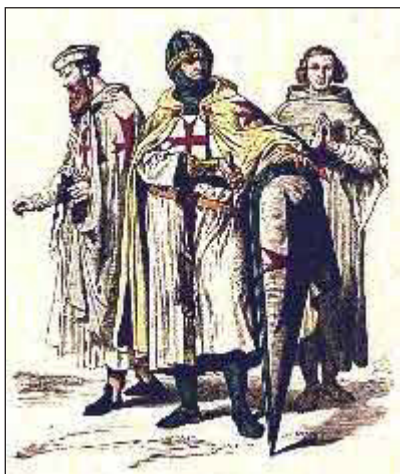
Sl. 1 Класично приказивање витезова реда Темплара