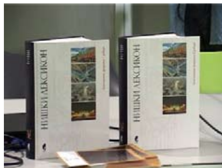
Городской лексикон Ниша

Лексикон Ниша был издан в пределах выпуска лексиконов городов Сербии, включающего 25 публикаций, представляющих все города в Сербии с официальным статусом города. Лексикон Ниша не только первый, но и самый важный в нашем выпуске, так как он устанавливает пределы современной лексикографии. Лексикон представляет Ниш как современный город, и в то же самое время дает ему историческое происхождение, сказал Слободан Гаврилович, директор Официальной газеты Сербии.