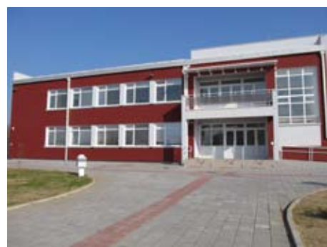
Департамент Начальной школы "Иво Андрич"

Министр Обрадович указал на важность хорошего сотрудничества между Министерством и местным правительством, которое привело к выполнению проекта, такого как постройка этой школы.