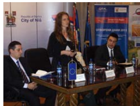
Дни открытых дверей - местное мероприятие

Мэр Ниша Милош Симонович в его приветственной речи выразил свои ожидания, что новые правовые регулирования, связанные с ГЧП, удалят все двусмысленности и позволят лучшие условия для развития.