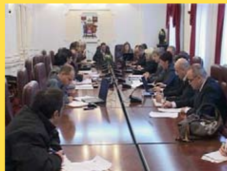
Заседание Городского совета Ниша

Генеральный план, принятый в июне 2006, устанавливал порядок для преобразования собственности в коммерческих целях и способы как вооруженные силы могут использовать