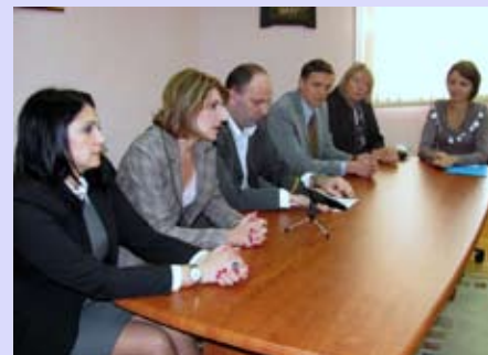
Делегация Internationaler Bund в Нише

Город Ниш и Городской муниципалитет Палилула начали сотрудничество с немецкой организацией Internationaler Bund, которая оказывает услуги инвалидам больше 30 лет.