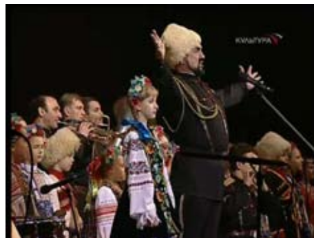
Кубанский казачий хор