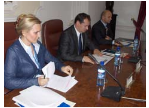
Конституционная сессия первого Совета по региональному развитию