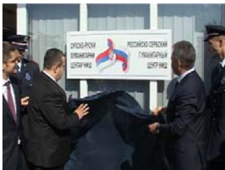
Региональный гуманитарный центр – мемориальная доска

Дачич и Шойгу посетили склад где будет помещена первая часть гуманитарного груза для будущего центра - палатки, генераторы и предметы первой необходимости, а также и помещение, предназначенное для штаба центра, где мемориальная доска с названием центра была символически представлена.