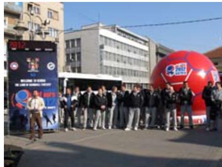
Часы Европейского чемпионата по гандболу ЕВРО 2012

Мэр Симонович сказал, что был уверен, что Ниш окажется достойным доверия, данного при выборе Ниша в качестве одного из мест встречи ЕФГ Мужского чемпионата по гандболу ЕВРО 2012. Согласно данным Сербской федерации гандбола, Город Ниш до сих пор был надежным партнером.