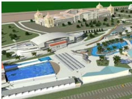
Взгляд комплекса на местоположении Лозни Калем в будущем