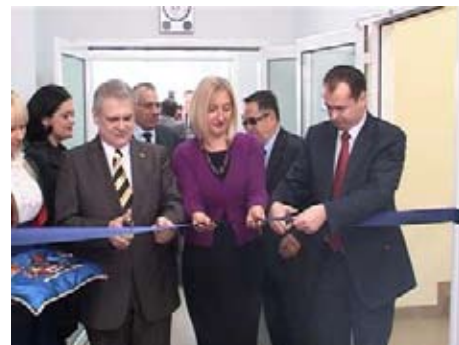
Открытие специальной больнице для гемодиализа Fresenius Medical Care

Инвестиции немецкой компании Fresenius Medical Care - доказательство, что у Города Ниша есть хорошее сотрудничество с зарубежными инвесторами,