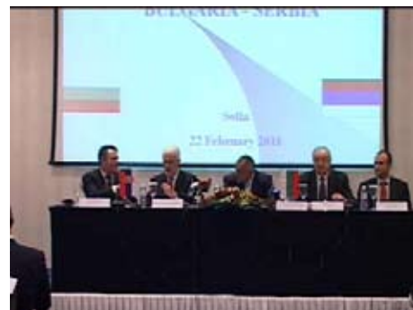
Деловой форум в Софии Сербия - Болгария

Официальная делегация сопровождалась деловой делегацией, состоявшей из бизнесменов Ниша, которые ехали в Софию с целью найти партнеров в Болгарии и предложить их продукты болгарским рынкам.