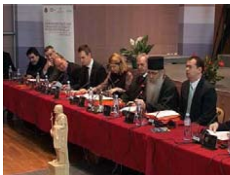
Дом Святого Савы Епархии Ниш

Мухаммед Юсуфспахич сказал, что подписание Миланского эдикта было важным событием для всех верующих, потому что это было редким случаем, что правитель принял религию угнетаемого.