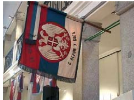
Сербский флаг от Первой мировой войны

Выставка в Нише была посещена вице-президентом Правительства Сербии и министром внутренних дел Ивицом Дачичем, представителям дипломатических миссий в Сербии и представителям