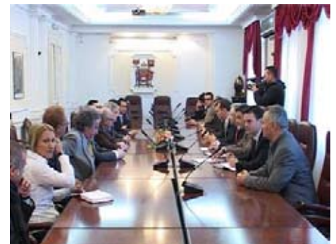
Городской совет Ниша принял Техничко-экономическое обоснование аренды строительной земли в индустриальной зоне Доне Меджурово и в комплексе Электронной промышленности

города. Самым большим успехом для нас, в городских учреждениях, является факт, что новые фабрики строятся после 20 лет лишенных любого производственного инициирования. Это хороший сигнал инвесторам, что именно Ниш место где они могут построить их новые фабрики и развить их деловые операции. Это не только обещания. Нам удалось заключить некоторые фактические соглашения и начать осуществлять их. Год 2011 будет первым годом уменьшения уровня безработицы. Ниш будет