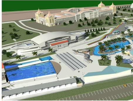
Взгляд комплекса на местоположении Лозни Калем в будущем