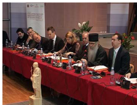
Дом Святого Савы Епархии Ниш

Мухаммед Юсуфспахич сказал, что подписание Миланского эдикта было важным событием для всех верующих, потому что это было редким случаем, что правитель принял религию угнетаемого.