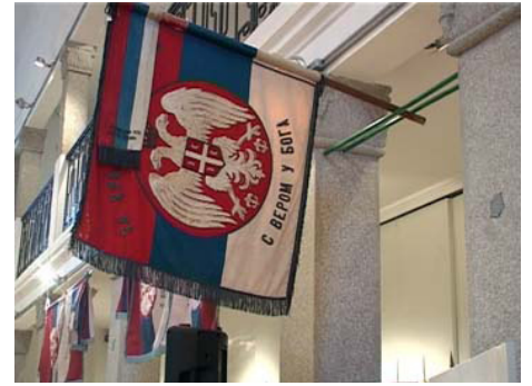
Сербский флаг от Первой мировой войны

Выставка в Нише была посещена вице-президентом Правительства Сербии и министром внутренних дел Ивицом Дачичем, представителям дипломатических миссий в Сербии и представителям