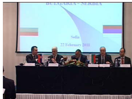
Деловой форум в Софии Сербия - Болгария

Официальная делегация сопровождалась деловой делегацией, состоявшей из бизнесменов Ниша, которые ехали в Софию с целью найти партнеров в Болгарии и предложить их продукты болгарским рынкам.