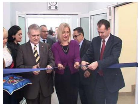
Открытие специальной больнице для гемодиализа Fresenius Medical Care

Инвестиции немецкой компании Fresenius Medical Care - доказательство, что у Города Ниша есть хорошее сотрудничество с зарубежными инвесторами,