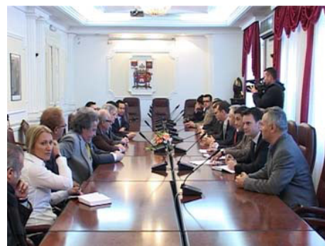
Городской совет Ниша принял Техничко-экономическое обоснование аренды строительной земли в индустриальной зоне Доне Меджурово и в комплексе Электронной промышленности

города. Самым большим успехом для нас, в городских учреждениях, является факт, что новые фабрики строятся после 20 лет лишенных любого производственного инициирования. Это хороший сигнал инвесторам, что именно Ниш место где они могут построить их новые фабрики и развить их деловые операции. Это не только обещания. Нам удалось заключить некоторые фактические соглашения и начать осуществлять их. Год 2011 будет первым годом уменьшения уровня безработицы. Ниш будет