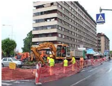
Булевар Др Зорана Тјинђића

У склопу ових радова, мењаће се водоводне и инсталације Градске топлане, као и уређење и поплочавање тротоара бехатон плочама, уређење паркинг простора и целокупног зеленила на траси