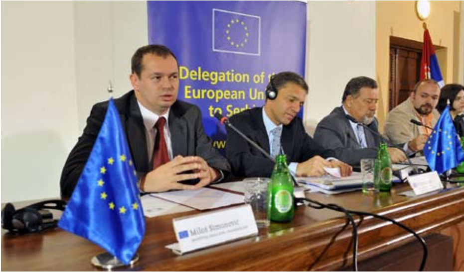
Конференција на Универзитету "Србија у Европској унији - изазови и могућности за омладину Србије"

Низом манифестација у Нишу је обележен Дан Европе.