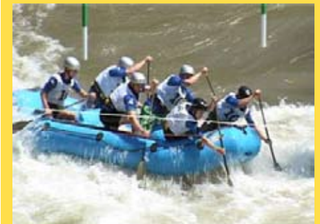
Рафтинг на Нишави

У Нишу је одражано Европско првенство у рафтингу, у организацији Рафтинг савеза Србије и под покровитељством Града Ниша.