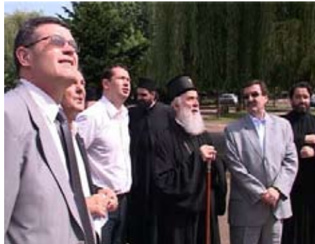
Патријарх Иринеј и званичници града Ниша у обиласку радова на Цркви Светог цара Константина и царице Јелене

- За прославу 1700 година Миланског едикта 2013. године овај храм биће у потпуности завршен и спремно ће дочекати овај велики јубилеј. Град Ниш је започео са великим инфраструктурним пројектима који ће повезати наше најзначајније културноисторијске споменике – Тврђаву, Ћеле Кулу и археолошки парк Медијана. Започели су велики радови на Булевару др Зорана Ћинђића, а следеће недеље