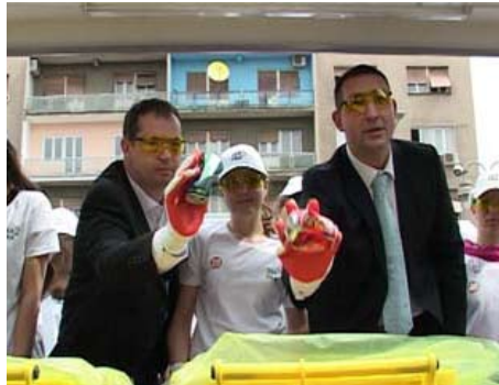
Рециклажа почиње из Ниша

- Ово је велики дан за Град Ниш у којем је већ велики број активности ка примарној - селекцији