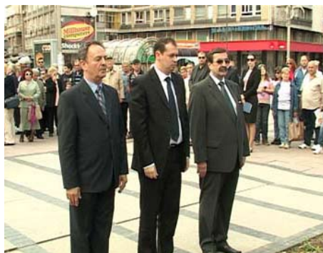
Полагање венаца на споменик Ослободиоцима Ниша

Пошту су одали и представници Нишавског округа, војске, полиције, СУБНОР-а, борачких удружења и Кола српских сестара. Поводом 65. годишњице победе над фашизмом у Дому Војске Србије одржана је свечана академија а венци су положени и на у Логору "12. фебруар".