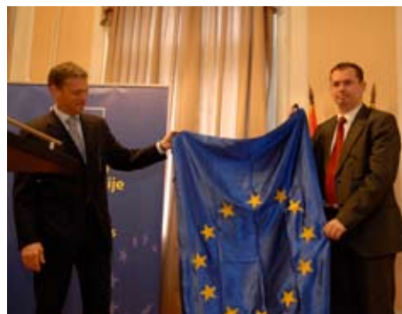
ЕУ застава за Град Ниш

друштва. Пред Србијом је задатак да постане земља без које Европа не може. На том путу има посла за све нас. Свако од нас биће у прилици да пружи свој допринос. Само пуном интеграцијом западног Балкана, са Србијом у центру, Европска унија ће постати простор истинске безбедности, стабилности и просперитета не само за старе већ и за нове чланице. Период који је пред нама је кључан за Србију јер у том времену имамо прилику да докажемо пуну посвећеност овом процесу и на тај начин обезбедимо грађанима Србије да уживу у благодетима које уживају грађани земаља чланица Европске уније, поручио је градоначелник Ниша.