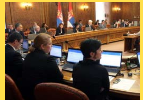
Влада Републике Србије

Владе Републике Србије усвојила је Програм за оживљавање великих индустријских центара - Ниша, Зајечара, Краљева и Новог Пазара, као и девастираних подручја чији је степен развијености испод 50 одсто републичког просека.