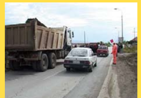
Улица Топличких партизанских одреда у Новом Селу

Сајам поред излагачког дела прате и бројна предавања, округли столови, трибине и едукативни семинари, конференције и презентације.