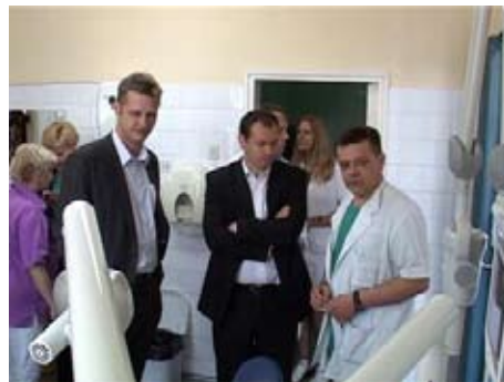
Клиника за стоматологију

мањег обима поред Одељења за болести зуба и ендодонцију КЦ Ниш подржао Специјалну школу са домом ученика Бубањ, Удружење