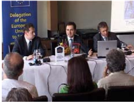
Презентација ИПА фондова

Потписивање споразума у Нишу знак је изузетне сарадње са Србијом али и са представницима локалне самоуправе чији ће резултат бити, како је рекао шеф Делегације ЕУ, успешна имплементација пројеката на територији читаве Србије. Поред