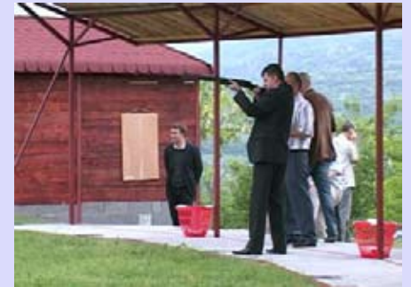
Отворено стрелиште у Малчи

На путу ка селу Малча, наоколице Ниша, на спортском полигону отворено је стрелиште за олимпијску дисциплину гађање глинених голубова.