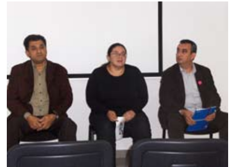
Дебата о људским правима