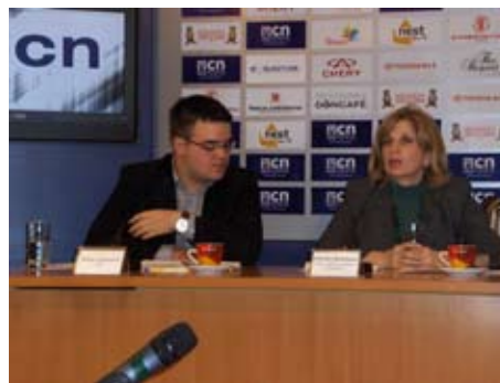
Дискусија са омбудсманом

најбоља фотографија са овог конкурса и постављена изложба радова учесника у ликовним радионицама.