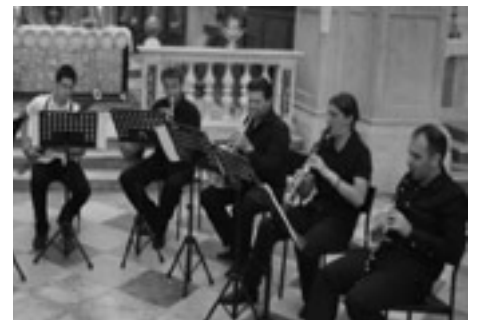
НИМУС 2011 – ПРИКЉУЧИ СЕ

Нишка публика имала је прилику да ужива и у опери "Мандрагола", која је изведена у Народном позоришту. Град Ниш је подржао организовање НИМУС-а са 5.720.000 динара, док је Министарство културе издвојило 500.000 динара.