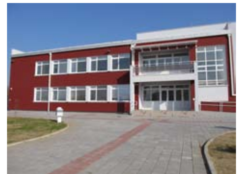
Новоизграђена основна школа у насељу "Бранко Бјеговић"

Површина објекта ОШ „Иво Андрић“, са фискултурном салом износи 3.350 м 2 . Износ завршених радова је 1.697.389,11 еура, а за канцеларијски и кухињски намештај, опрему за фискултурну салу и аудио,