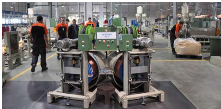
Производни погон нове фабрике "Шин Вон" у Нишу

Јужнокорејска компанија "Јура" отворила је у Нишу нову фабрику "Шин Вон", у којој се производе каблови за аутоиндустрију.