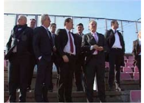
Челници ФСС у Нишу