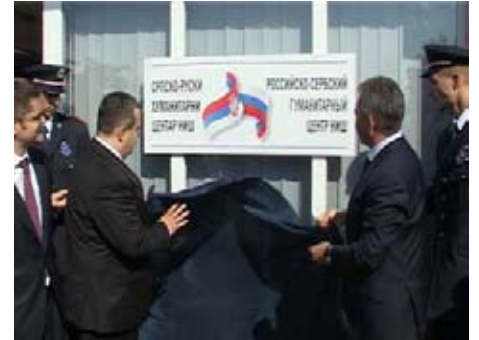
Отварање центра за ванредне ситуације у Нишу

“Овакви центри имају значај у свим деловима света и у отклањању последица елементарних непогода и у томе не треба тражити никакву лошу конотацију, јер је ово отворен пројекат и није усмерен ни против кога. Биће