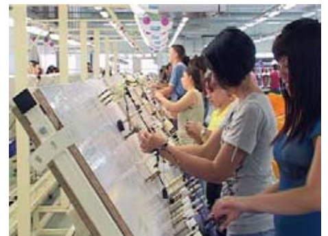
Првих стотину радника почело је да ради у фабрици Шин Вон