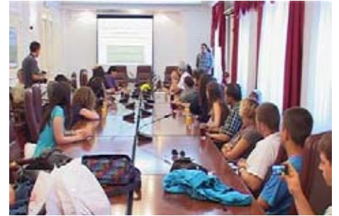
Пријем у Градској кући

- Оно што ћете грађанима Ниша оставити као своје дело је веома вредан поклон нашем граду