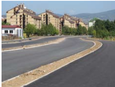
Новоизграђени Булевар Медијана

Он каже да није било лако донети одлуку о реконструкцији највеће градске саобраћајнице у центру града и изградњи нових булевара. Међутим, били смо одлучни