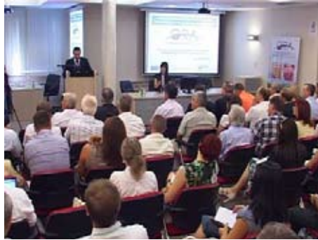
Пословни скуп малих и средњих предузећа на тему „Доступни програми финансирања и подршке малим и средњим предузећима у Републици Србији“

Скуп је окупио фирме које се баве извозом и иновационом делатношћу и треба да допринесе побољшању њихове међусобне размене искустава и примера добре праксе. Суштина окупљања је да се фирме упознају са програмима који нуде бесповратна средства као и субвенционирани кредити како би њиховим коришћењем повећали сопствену конкурентност, извоз и унапредили иновативну делатност. Пословни скуп нуди могућност успостављања и јачања двосмерне комуникације између предузећа и институција, а све у циљу стварања повољног пословног окружења и анимирања других предузећа да крену у послове извоза и иновација.