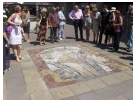
Мозаик у Обреновићевој улици

У оквиру Летње школе Београдског универзитета уметности одрађена су два мозаика. Мозаици, ширине два и по и дужине три метра, урађени су од природног камена.