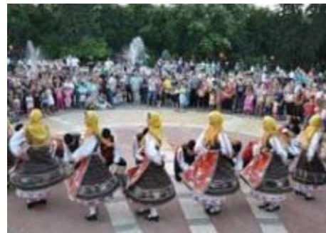
Међународни студентски фестивал фолклора

Организатор фестивала, Студентски културни центар истакао је да се сваке вечери у дворишту зграде Универзитета организују забаве где чланови фолклорних ансамбала али