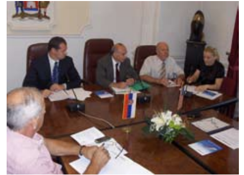
Прва седница Међуопштинског форума Ниша, Лесковца, Гаџиног Хана, Дољевца и Мерошине

Циљ пројекта, у оквиру петогодишње УСАИД иницијативе за одрживи локални развој вредне 22 милиона долара, је да подржи партнерства између локалних власти, бизниса и организација цивилног друштва како би се објединила знања и ресурси општина и створили повољнији услови за инвестиције и економски раст.