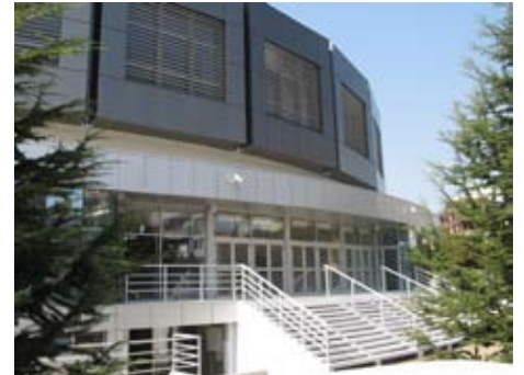
Нов изглед спортске хале Чаир

ФОТО ГАЛЕРИЈУ ХАЛЕ ЧАИР МОЖЕТЕ ПОГЛЕДАЈТЕ НА САЈТУ ГРАДА НИША