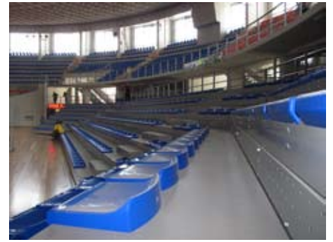
Спортска хала Чаир - нове трибине

И тим поводом Рукометни савез Србије обратио се градоначелнику Ниша са захтевом да први такмичарски дан буде одигран у реконструисаној хали Чаир, 3. новембра. Спортски рукометни догађаји у октобру и новембру биће први пробни спортски мечеви уочи великог спортског догађаја почетком 2012. године. Према програму међународног турнира "Куп Нације", првог такмичарског дана у хали Чаир биће одигране две утакмице: Србија – Мађарска и Хрватска – Чешка.