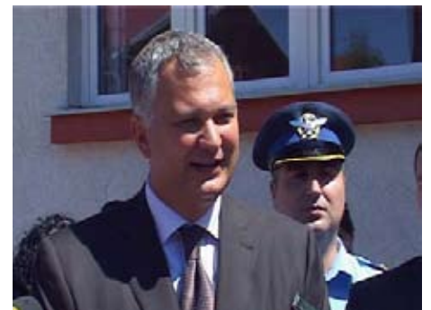
Министар одбране РС Драган Шутановац

Модел сарадње Војске Србије и Града Ниша репрезентативни је пример сарадње Министарства одбране и локалних самоуправа, рекао је градоначелник Ниша и додао да ће после завршене процедуре размене непокретности коначно у пуној мери бити стављено у функцију земљиште у касарни "Бубањски хероји" површине 15 ха. Град Ниш још једном ће потврдити свој пример добре праксе у сарадњи са Владом Србије реализацијом нових пројеката