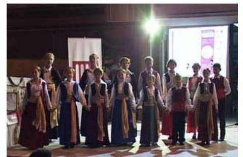
Песме и плесови народа света