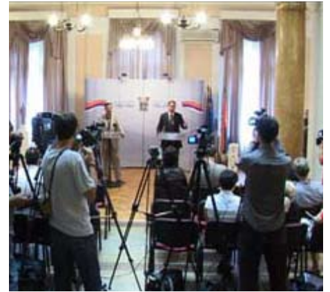
Прес конференцији поводом три године од ступања на дужност

Упркос тешкој економској кризи планирано је да се започети објекти заврше, као и да се не понови грешка из прошлости да се отпочне са изградњом значајних инфраструктурних објеката и да та изградња потраје и 20-так година, рекао је Симоновић и нагласио да није било лако донети одлуку о реконструкцији највеће градске саобраћајнице и изградњи нових булевара. Међутим, били смо одлучни у намери да потпуно реконструирамо најоптерећенију