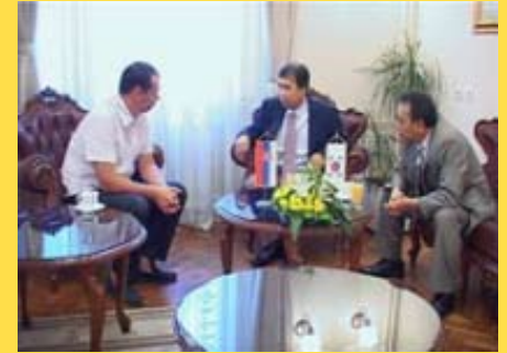
Пријем за амбасадора Јужне Кореје у Градској кући