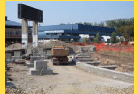
Друга фаза радова на стадиону Чаир

После припремних радова, у другој фази грађевинских радова предвиђена је изградња бетонских конструкција на источној, јужној и северној трибини. Тако ће бити постављен скелет за три трибине стадиона Чаир како би даље били настављени грађевински радови на изградњи.