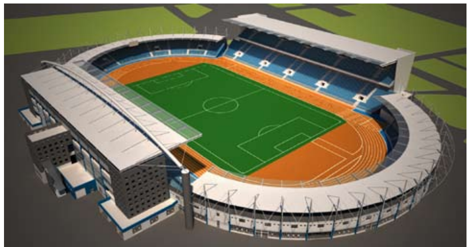
Вид Стадиона „Чаир“ в будущем

Реконструкция стадиона "Чаир" в Нише официально началась 30 марта 2011, сносом старых трибун на восточной стороне стадиона.