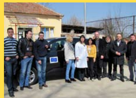
Новое транспортное средство для мобильных команд

Городской муниципалитет Палилула получил новое транспортное средство как часть Проекта Exchange 3 для того, чтобы поднять способности муниципалитета к улучшению качества жизни социально уязвимых групп граждан.