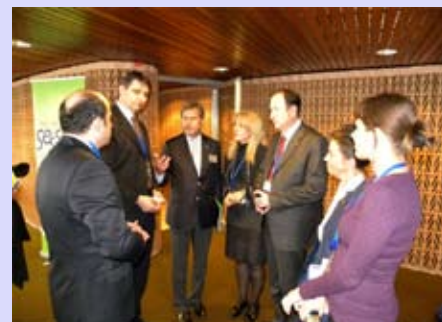
Конгресс в Страсбурге

В Страсбурге проведена 20-ая сессия Конгресса местных и региональных властей Совета Европы.