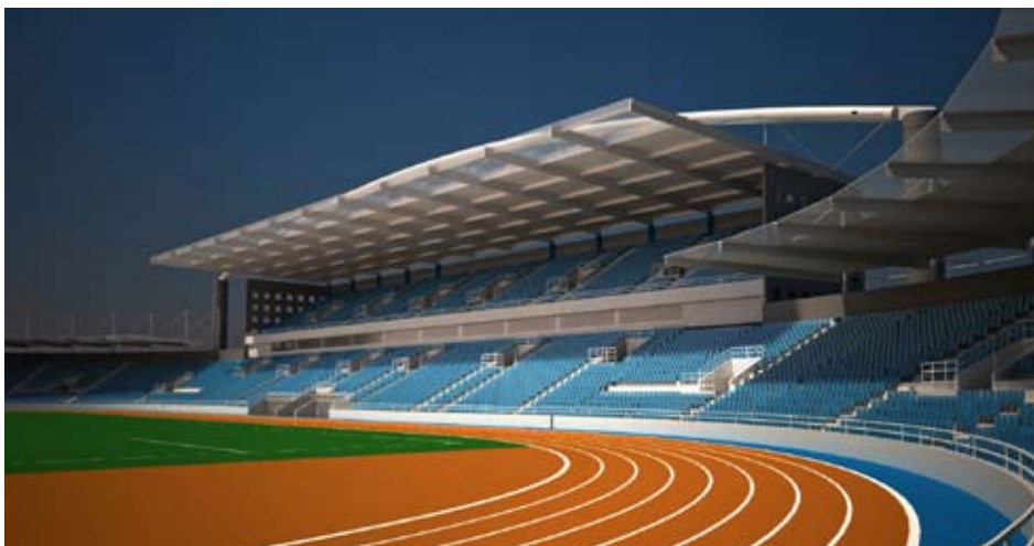
Вид Стадиона „Чаир“ в будущем – восточная трибуна

925 миллионов динаров будут необходимы для заканчивания реконструкции. И Город Ниш и Правительство Республики Сербии ассигнуют 10% от необходимых средств из своих бюджетов на 2011 год, а остальные средства будут обеспечены от кредитного лимита Фонда развития РС.