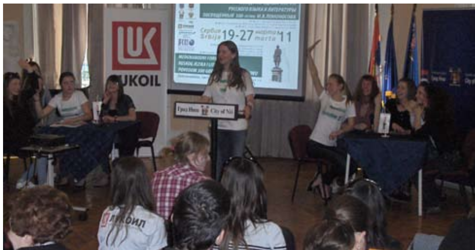
Международный форум русского языка и литературы

Цель проекта была сплотить народы Сербии и России через молодое поколение, повысить культурный уровень участников проекта и дать возможность каждому войти в мир традиций и культуры в процессе проведения мероприятия. Форум проходил в форме "вопросы - ответы за минуту!", а по окончании форума участники получили памятные призы и дипломы.