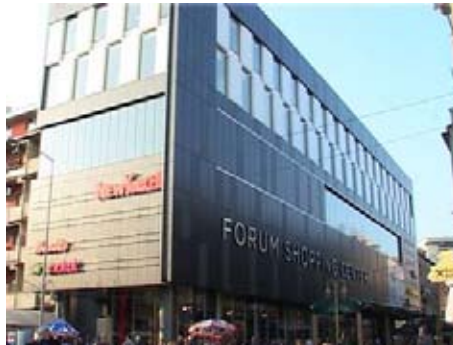
Новый торговый центр "Форум"

Ниш получает великолепное здание в центре города, где некоторые модные бренды откроют свои магазины впервые в Сербии. Особенно важен факт, что этот торговый центр наймет 500 человек. Город Ниш еще раз подтвердил, что может быть надежным партнером в реализации всех инвестиций. Одним из результатов также будет пожертвование детской площадки, которая будет скоро настроена в Крепости Ниша, сказал мэр Симонович.