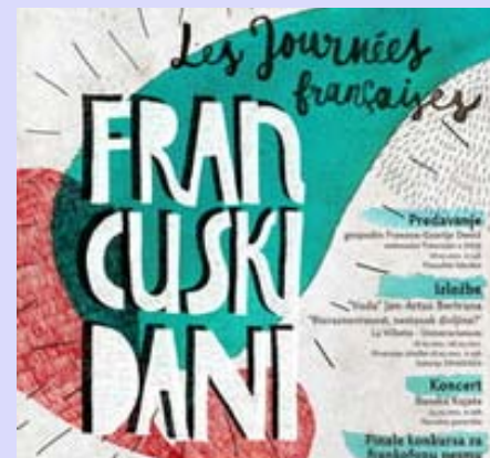
Французские дни в Нише

Французский Институт Ниш, в сотрудничестве с Городом Нишем и местным учреждениям, организовывал Французские дни восьмой раз подряд.