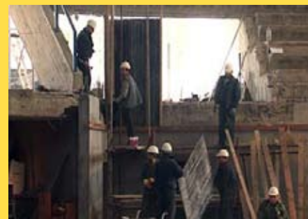
Реконструкция Спортивной арены „Чаир“

Стадион "Чаир" был построен в 1963 году. В течение прошлых 30 лет не было никаких инвестиций. После реконструкции в соответствии со стандартами FIFA у Стадиона Ниш будет абсолютно новый взгляд.