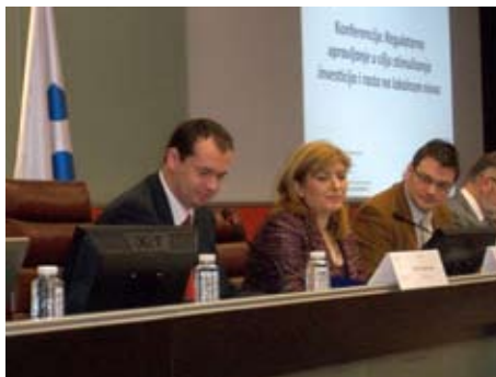
ИФЦ Заключительная конференция