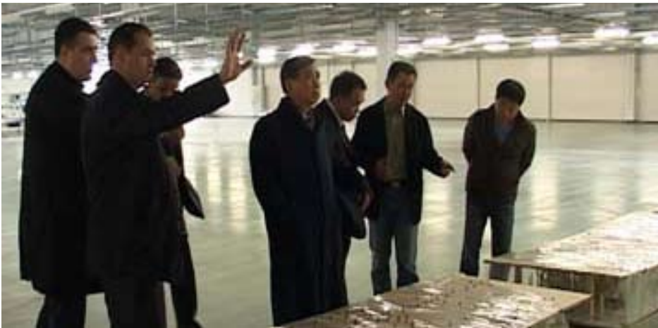
Корейский посол посетил фабрику "Юра корпорации"

Городской мэр Милош Симонович и глава Департамента по делам местного экономического развития Милан Ранджелович вместе с послом Южной Кореи в Сербии Ким Джонгхэ посетили недавно построенную фабрику "Юра корпорации" для производства электрооборудования для автомобильной промышленности в местоположении Доне Меджурово.