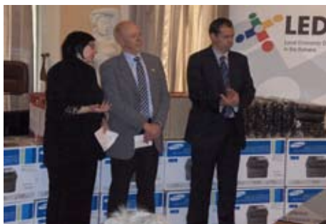
Компьютеры и программное обеспечение для средних школ

Контракт на пожертвование компьютерного оборудования был