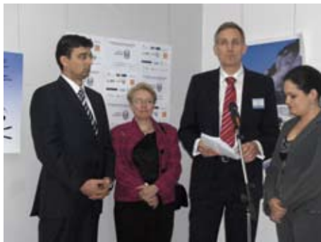
Дни Орхуса в Нише

Помимо главной выставки, у граждан Ниша по вечерам была возможность видеть показ датских документальных фильмов. Также, дети могли участвовать в мастерской, посвященной известному датскому автору сказок Гансу Кристиану Андерсену. Дети могли узнать о Дании, Городе Орхусе и Гансе Кристиане Андерсене. Каждый ребенок получил