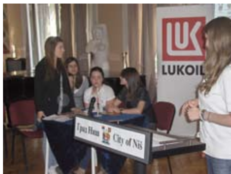
Вопросы - ответы за минуту!