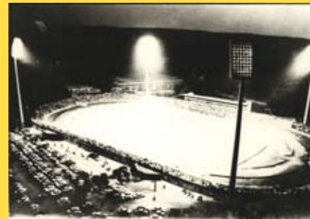
Первый матч под прожекторами

Стадион "Чаир" был построен в 1963 году. В течение прошлых 30 лет не было никаких инвестиций. После реконструкции в соответствии со стандартами FIFA у Стадиона Ниш будет абсолютно новый взгляд.