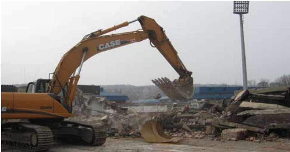
Начало работы: снос старых трибун

Сегодня тот день, когда все мы можем быть удовлетворены. Стадион "Чаир" - самый большой проект, стоящий почти 1 миллиард динаров. Помимо факта, что Ниш получит современный стадион, также важно сказать, что между 500 и 1000 рабочих - строителей будет нанято этим проектом. Я ожидаю, что, когда я вернусь в Ниш через 270 дней, мы откроем стадион, сказал министр Дулич.