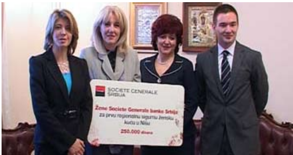
Пожертвование "Сосьете женераль" для Явочной квартире

Банк "Сосьете женераль" пожертвовал 250.000 динаров для Явочной квартире.