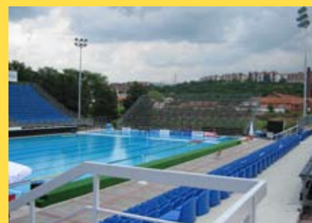
Комплекс бассейнов в Спортивном центре "Чаир"

Город Ниш получит современный спортивный комплекс с восстановленным стадионом, ареной "Чаир" и бассейном на открытом воздухе.