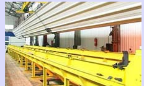
Производство "Batiqoc" в Нише

Французская компания "Batiqoc" вместе с ее партнерами "Batiroc" и "AXE METAL" открыла производство в зале компании МИН - Специальные транспортные средства. Мэр Ниша Милош Симонович, при официальном открытии завода, нажал первую кнопку, начинающую производственную линию.