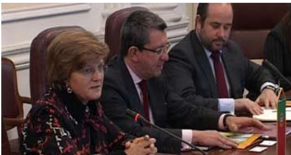
Делегация из Португалии

Делегация португальского Министерства окружающей среды и пространственного планирования во главе с министром госпожой Дулсе Пасаро приехала в официальный визит в Сербию.