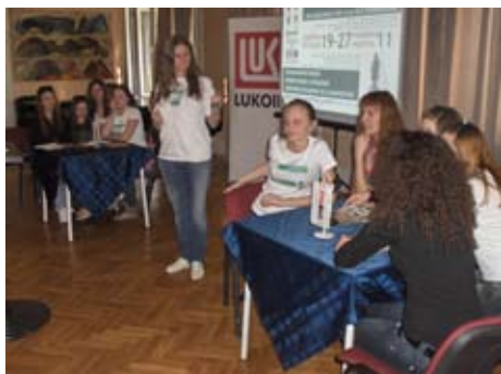
Конкурс на лучшее знание жизни и деятельности М. В. Ломоносова