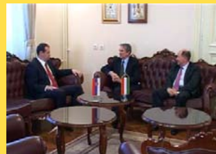
Венгерский посол в Сербии Озкар Никовиц

По случаю празднования второй годовщине Почетного консульства Венгрии в Нише, венгерский посол в Сербии Озкар Никовиц посетил Город Ниш и встретился с мэром Милошем Симоновичем.